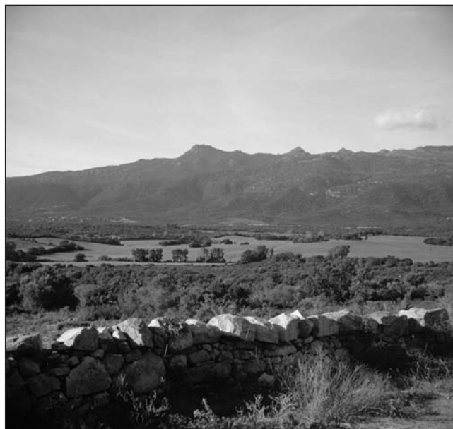
Sud stremu, piaghja di Figari