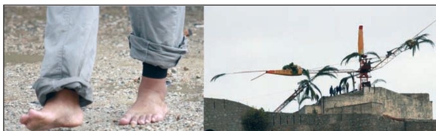
Pieds dans l'eau et danse d'oeuvre-monumentale marque officiellement le fin de l'été à Calvi

Cette année, le thème « Jette pas ton mégot, deviens un héros » était au cœur d'une programmation de courants d'air colorés, porteurs de messages, d'idées, de philosophie. A défaut d'une véritable mise en échec du tabac et de sa consommation, ce message appelle au respect de l'environnement. Voilà le leitmotiv d'un festival qui souffle depuis 19 ans sur la Balagne , dans un esprit joyeux et festif mais pas moins constructeur d'avenir : un tremplin d'actions éco-citoyennes concrètes aptes à sensibiliser et mobiliser les consciences autour des problèmes de l'environnement.