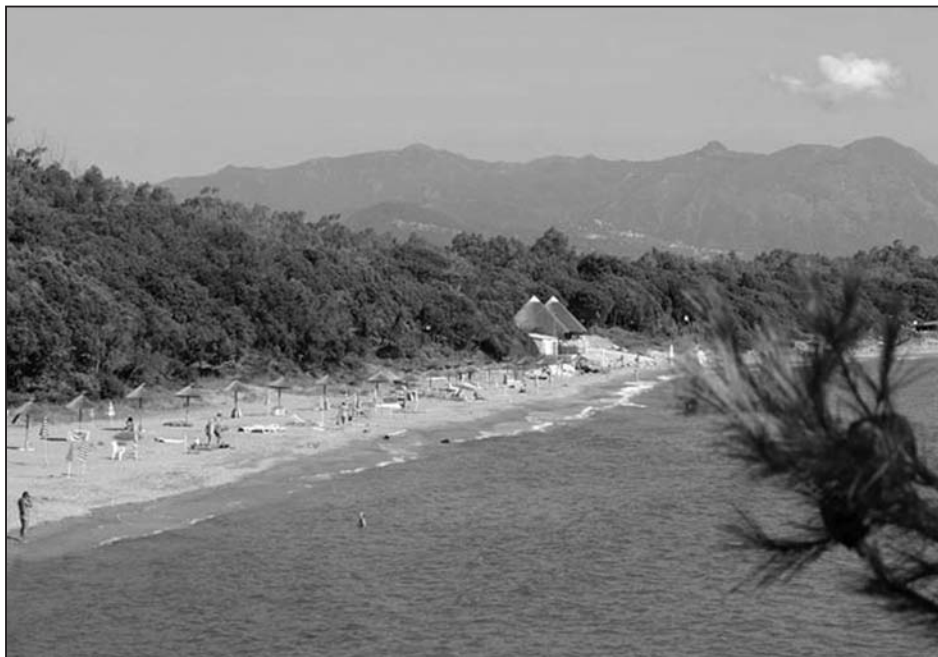
Le Domaine de Baghera, vaste domaine ouvert sur l'Océan. Mais le Cross se déroulera sur la terre ferme, une terre végétale et pelusée...