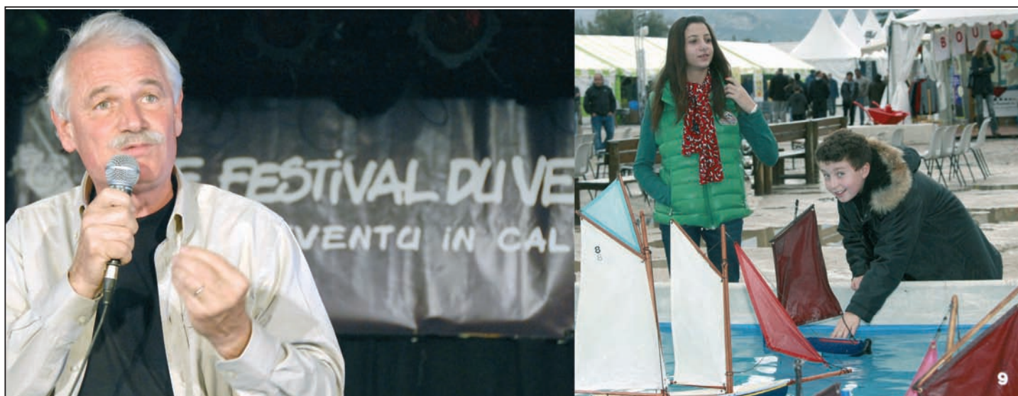
Le message de Yann Arthus Bertrand s'adresse aux jeunes générations qui continuent d'aimer le refrain « maman les petits bateaux »

S'affirme comme l'événement de l'automne à Calvi