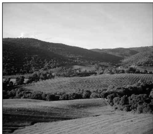
Rughjone di Sarte, vicinu a Serraja